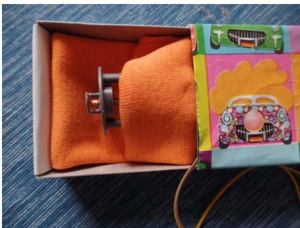
op de uitslaapkamer