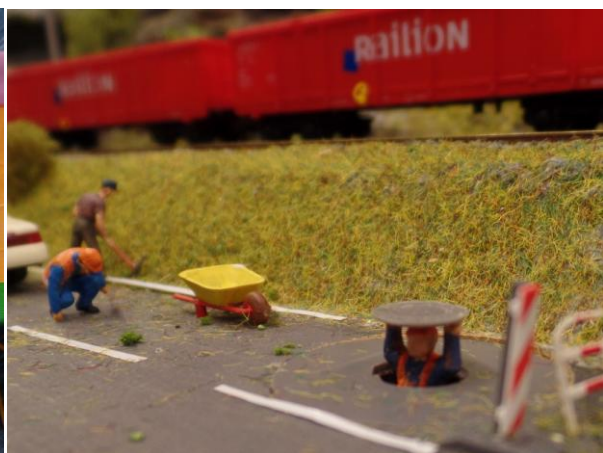
druk op de knop!