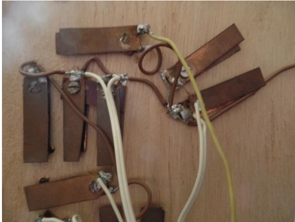
onderzijde oud schakelbord: wekkerveren

Pas op zondagavond vond ik tijd voor het opwindende deel van de operatie. Een tie rib zette mijn boormachine (met sjoband vastgezet op een stoel) op de laagste snelheid in beweging. Een geïmproviseerde voetpedaal zorgde er voor dat ik met twee handen de draad kon geleiden. Dit moesten ze bij Faller eens zien: supervlot werd de spoel weer dikker en dikker. Nou ja, op dat stuk na waar de nodige kinken in zaten; dat kostte me meer dan een uur om het uit de knoop te halen. De rest was een peulenschil. Toen ik met een grote grijns constateerde dat de rioolwerker weer aan het werk kon, maakte ik met een paar drupjes secondelijm de boel definitief vast. Voor het laatste herstel en zorgvuldig vervoer naar de club legde ik hem in een lekker bedje, met infuus via de kabel.