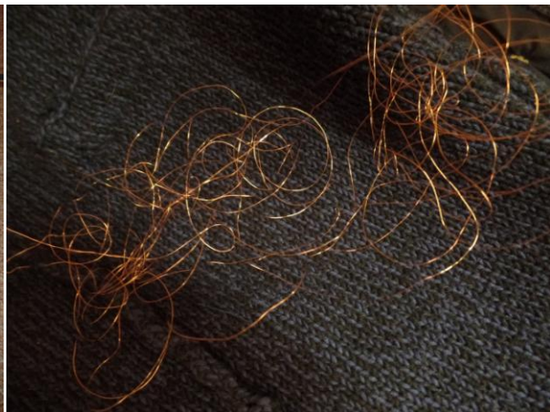
oei, een tikje in de war geraakt...