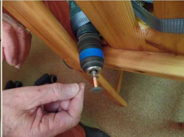
spoeltje op de vastgesjorde boormachine