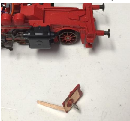
fig. 10: de "Federplatte" voor de inbouw

Nadat de motor was binnengekomen heb ik meteen even een foto gemaakt als vergelijking, om te zien wat er nu verschilt en waarom de motor in de ene configuratie niet en in de andere configuratie wel werkt. Op de linker configuratie zie je dat het ijzerpakket van de permanentmagneet niet in de buurt komt van de vijfde pool van het anker. De standaardmagneet van Märklins vijfpolige motor omsluit het anker veel beter, waardoor het magnetisch veld goed zijn werk kan doen. Gelukkig, de motor zit erin en het wachten is op het laatste onderdeel. De "Federplatte" voor het monteren van de frontverlichting en later te plaatsen stoomgenerator stond op nalevering vanuit de fabriek. Begin maart besteld en uiteindelijk werd het onderdeel eind juli geleverd. Dus een beetje geduld hadden we wel nodig.