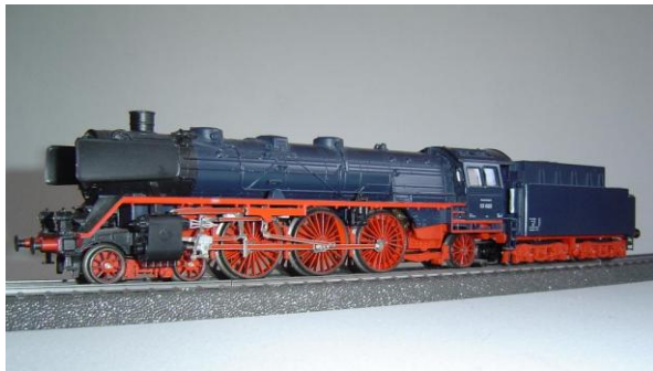
fig. 1: originele kleurstelling

De 03-1022 loc was behoorlijk toegetakeld door de vorige eigenaar, welke schijnbaar niet blij was met de oorspronkelijk blauwe kleur (fig. 1). De loc was namelijk behoorlijk vervuild en zag er gewoon zwart uit (fig. 2). Op zich niet lelijk maar de teksten waren niet meer te lezen. Daarbij miste er een complete lantaarn aan de voorzijde en de kortkoppeling achterop was afgebroken. Er zat een rookgenerator in, alleen was daarvan het naaldje zoek.