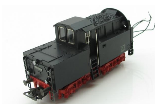
fig. 5: complete tender van een BR 050

tender verwisselde van eigenaar. Eenmaal thuis bleek de kap van de tender vrijwel nieuw, een mooie vervanging voor de kap van mijn BR 50 (3084) welke al tekenen des tijds vertoonde.