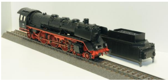
fig. 3: loc- en tenderkap en loc onderstel

Begin dit jaar kwam ik via Marktplaats in het bezit van een compleet nieuwe kap van een BR 03 in het zwart. Perfect om de “vervuilde” kap te vervangen. In beginsel was ik er best blij mee, maar de kap stak nu wel erg af bij het vervuilde onderstel. Dus een bepaalde onvrede speelde in mijn achterhoofd. Een tweetal weken later kwam ik op Marktplaats een onderstel tegen van een BR-03 met “gezwart drijfwerk”. Een tandwiel was kapot maar dat is vrij simpel te vervangen en er ontbraken wat kleine onderdelen die ook te bestellen waren. Een buitenkantsje dus, maar zo had ik ineens voor bijna driekwart een complete loc liggen. Zo werd het