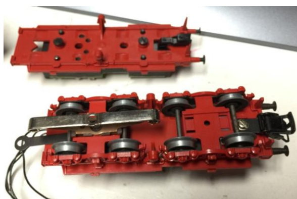
fig. 6: de bodemplaat van de BR 03 en het onderstel van de tender van de BR50

De wielstellen kwamen overeen met mijn eerste BR 003.160-9 (Mä3085) dus dat bood perspectief. Mooi zou het zijn om deze op de andere bodemplaat te monteren van Jasper, omdat hieronder ook een voorziening zat voor een kortkoppeling. Na een middagje demonteren en monteren pasten de wielstellen onder de andere bodemplaat en de kap kon er op. Zo stond er alweer een bijna complete locomotief. Nu was het tijd om de ontbrekende onderdelen te bestellen bij de firma Keuterman. Ik was er vanuit gegaan dat het kapotte tandwiel identiek zou zijn aan dat van de Mä3085. Dat bleek bij aflevering helaas niet zo te zijn (fig. 7). Daarom heb ik de juiste afmetingen doorgemailed en het juiste tandwiel besteld.