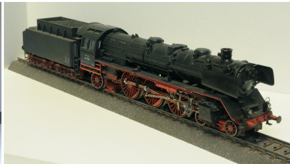
fig. 2: mijn “vervuilde” versie

Via de firma Keuterman heb ik destijds een nieuwe lantaarn voor het voorfront en een kortkoppeling gekocht. Een lid van het 3-railforum was zo vriendelijk om mij een reservenaaldje te sturen waardoor de loc ook weer kon roken. Met een tweetal nieuwe lampjes erbij was de loc weer operationeel. Onlangs heb ik met wasbenzine de teksten weer leesbaar gemaakt zonder dat de blauwe kleur te veel zichtbaar wordt.