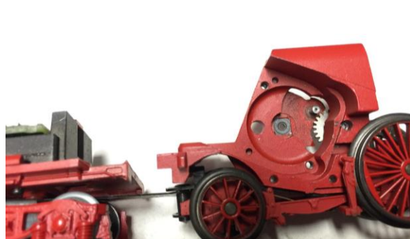
fig. 7: het ene tandwiel is het andere niet!

De wielstellen kwamen overeen met mijn eerste BR 003.160-9 (Mä3085) dus dat bood perspectief. Mooi zou het zijn om deze op de andere bodemplaat te monteren van Jasper, omdat hieronder ook een voorziening zat voor een kortkoppeling. Na een middagje demonteren en monteren pasten de wielstellen onder de andere bodemplaat en de kap kon er op. Zo stond er alweer een bijna complete locomotief. Nu was het tijd om de ontbrekende onderdelen te bestellen bij de firma Keuterman. Ik was er vanuit gegaan dat het kapotte tandwiel identiek zou zijn aan dat van de Mä3085. Dat bleek bij aflevering helaas niet zo te zijn (fig. 7). Daarom heb ik de juiste afmetingen doorgemailed en het juiste tandwiel besteld.