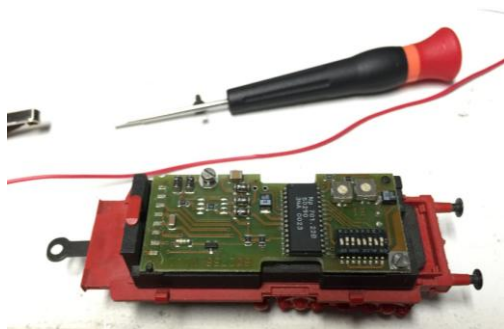
fig. 4: bodemplaat incl. 6090x decoder

De eerste zaak was nu om te kijken of we een onderstel konden vinden voor de tender van de BR 03. Gelukkig maakt de 03 gebruik van de eenheidstender, welke ook achter een BR41 en een BR50 werden gebruikt, dat vergemakkelijkte de zoektocht enigszins. Helaas was hier in Nederland niets te vinden dus moest ik mijn geluk over de grens beproeven. Via e-Bay vond ik al snel een complete tender voor een BR 50 met cabine (fig. 5). Deze zou in principe achter de 03 moeten passen en een kwestie van overzetten van de kap zou moeten volstaan. Dus contact gezocht met de verkoper en de