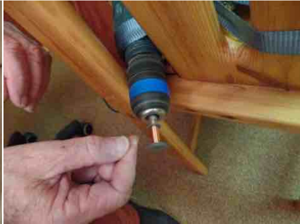
spoeltje op de vastgesjorde boormachine