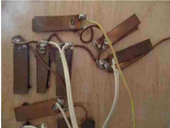
onderzijde oud schakelbord: wekkerveren

Pas op zondagavond vond ik tijd voor het opwindende deel van de operatie. Een tie rib zette mijn boormachine (met sjoband vastgezet op een stoel) op de laagste snelheid in beweging. Een geïmproviseerde voetpedaal zorgde er voor dat ik met twee handen de draad kon geleiden. Dit moesten ze bij Faller eens zien: supervlot werd de spoel weer dikker en dikker. Nou ja, op dat stuk na waar de nodige kinken in zaten; dat kostte me meer dan een uur om het uit de knoop te halen. De rest was een peulenschil. Toen ik met een grote grijns constateerde dat de rioolwerker weer aan het werk kon, maakte ik met een paar drupjes secondelijm de boel definitief vast. Voor het laatste herstel en zorgvuldig vervoer naar de club legde ik hem in een lekker bedje, met infuus via de kabel.