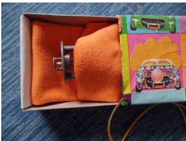
op de uitslaapkamer