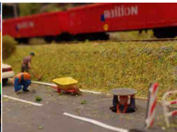
druk op de knop!