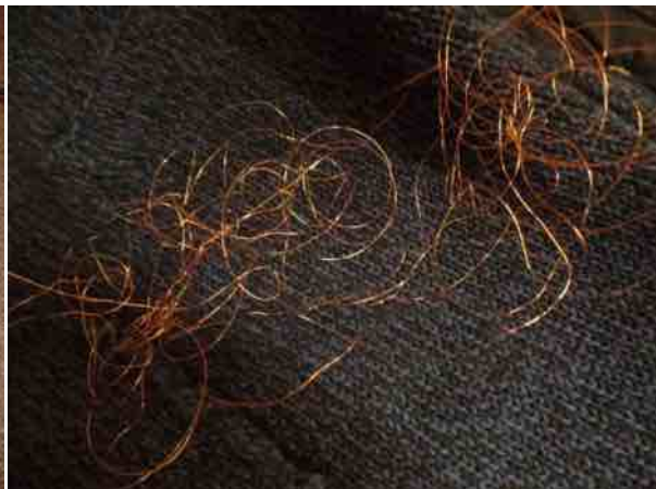
oei, een tikje in de war geraakt...