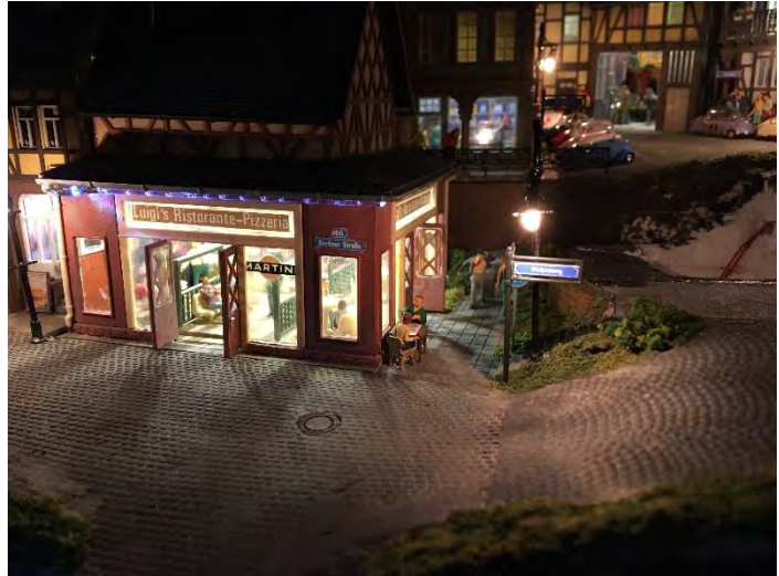
pizzeria met bling-bling langs de gevel