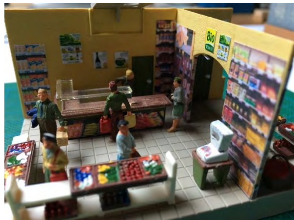
een deel van de supermarkt