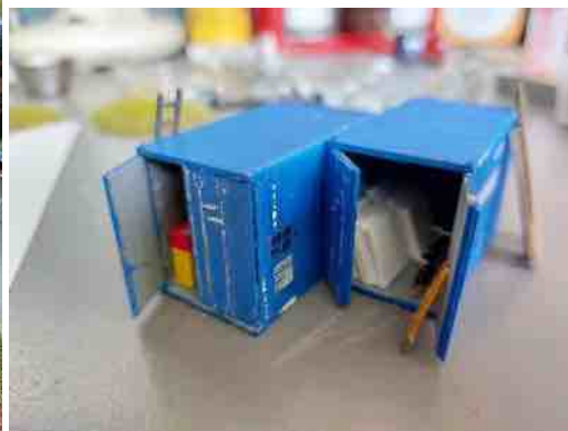
inkijkje in mijn containers