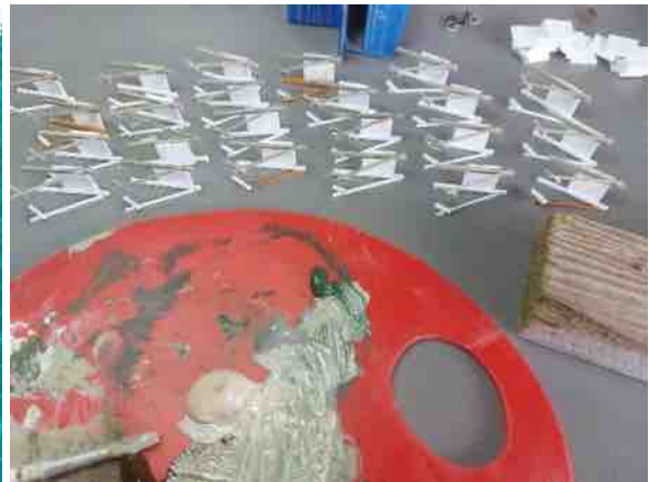
panelen op de juiste kleur brengen