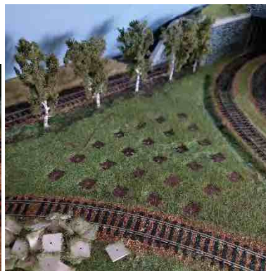
kort gras is ingezaaid