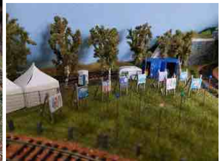
de eerste panelen staan