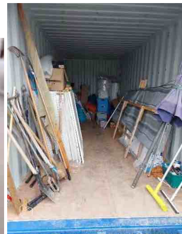
inhoud echte container