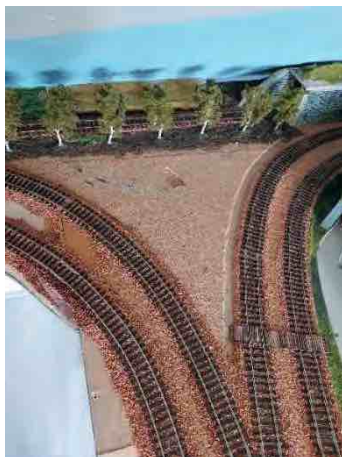
het beoogde perceel

Totdat Dirk Hakze een paar kilometer verderop neerstrijkt met zijn performance! Eerst kom je er bij toeval langs, de tweede en de derde keer verwonder je je over steeds weer nieuwe schilderijen, de vierde keer krijg je een ingeving... Dus maak je een paar foto's die waarschijnlijk geen enkele bezoeker maakt: de inhoud van de blauwe containers, de auto van Dirk, het toegangshek met de kubussen. Gewapend met een rolcentimeter noteer ik de maten van de constructie van de panelen en van de pagodetenten.