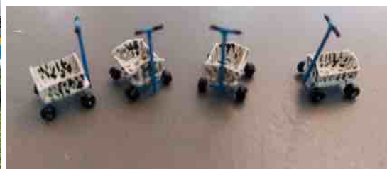
mijn minifield-bolderwagens 12x6 mm