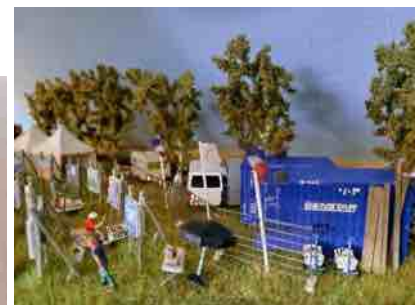
in het diorama

Tijd om het beoogde veld bouwrijp te maken. De zes berkenbomen sluiten het veld aan de achterzijde prachtig af. Aan de rechterkant leg ik een slootje aan, compleet met waterplantjes en zwanen. Voor wie het weten wil: het water bestaat uit twee lagen jachtlak. Links vormt een