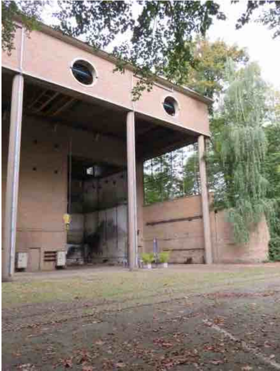
Vooraanzicht van de hal.