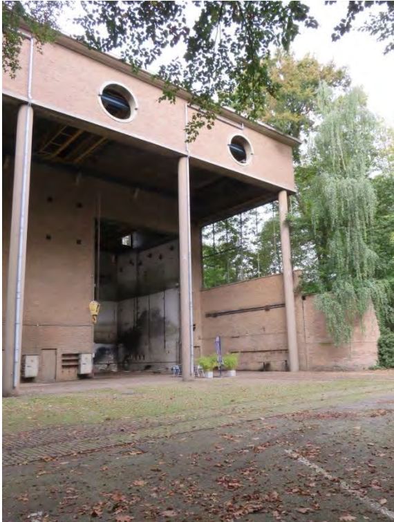
Vooraanzicht van de hal.

Hieronder een testopstelling in de jaren '30 met de apparatuur op een lorrie.